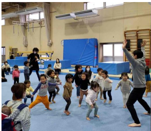
*パノラマホールで体を思いきり動かそう!