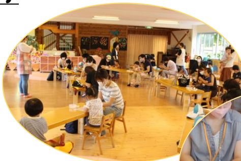
お部屋でじっくり 「つくって遊ぼう」